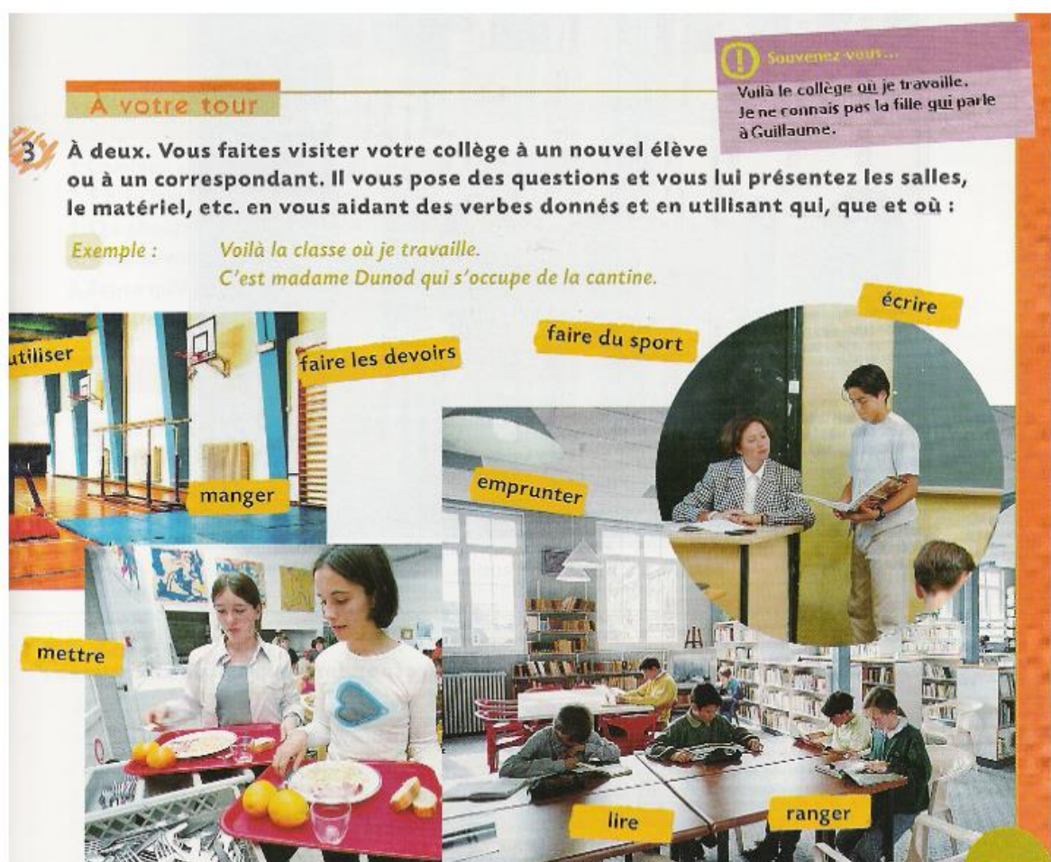
C. Bergeron, M. Albero et M. Bidault : Tandem , niveau 2, Didier, 2003, page 23.

– Dans l'approche communicative, l'aire privilégiée est la C (la simulation d'actions, sous forme de présentation d'un sketch ou jeu de rôles par les élèves eux-mêmes), l'étayage étant réduit (du moins dans les manuels qui systématisent cette approche) au strict minimum, que ce soit en termes de préparation (a1), soutien (a2) ou reprise (a3). La page du manuel Tandem (Didier, 2003) présentée ci-après me semble en fournir un bon exemple 9 :